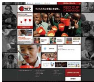
「RED CUP CAMPAIGN」ウェブサイトのイメージ

国連WFP協会は、飢えと貧困に苦しむすべての子どもたちが、飢えることなく、健全に成長し、学び、貧困を克服できるように、「RED CUP CAMPAIGN」を通じて、様々な働きかけを行います。私たち1人ひとりの力で、給食が1人でも多くの子どもに届く、世界がより良くなっていく、それが「RED CUP CAMPAIGN」の願いです。ぜひ、「RED CUP CAMPAIGN」にご協力ください。