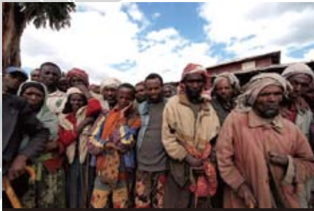
食糧を受け取りに来た干ばつ被災者たち。

この10月、WFPオフィシャルサポーターを務める富永愛さんが、食糧危機に苦しむエチオピアを訪問しました。