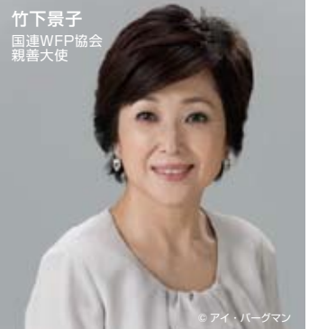
竹下景子 国連WFP協会 親善大使