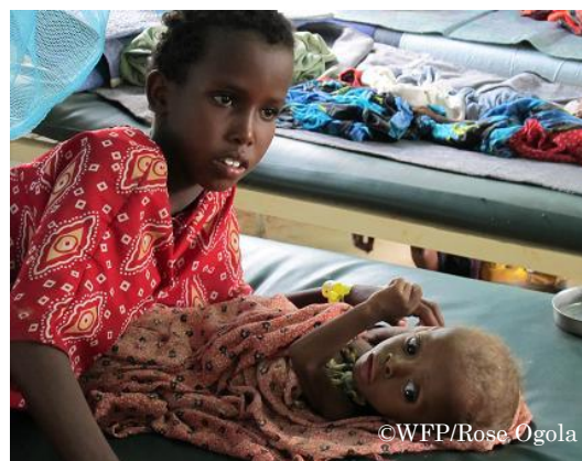
懸念される子どもたちの状況。

アフリカ北東部の「アフリカの角」と呼ばれる地域は、いま世界で最も飢餓が深刻な場所のひとつです。ケニア、ジブチ、ウガンダ、エチオピア、ソマリアなどの国々を含むこの地域における飢餓は、干ばつや紛争、食糧価格の高騰など、いくつもの要因が絡んだ根の深いものです。現在「アフリカの角」で発生している深刻な人道危機に対し、WFPは、各国政府や他の国連機関、NGOとのパートナーシップを通して、緊急支援の規模を拡大すると同時に、今後影響を受ける人が出ないようにするための長期的な解決策の構築に着手しています。今回の緊急支援においてWFPは、